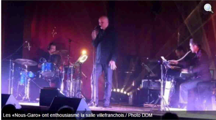
Les «Nous-Garo» ont enthousiasmé la salle villefrancois