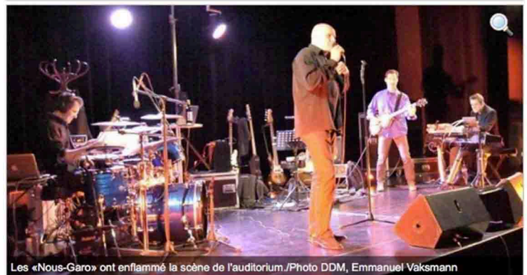
Les «Nous-Garo» ont enflammé la scène de l'auditorium